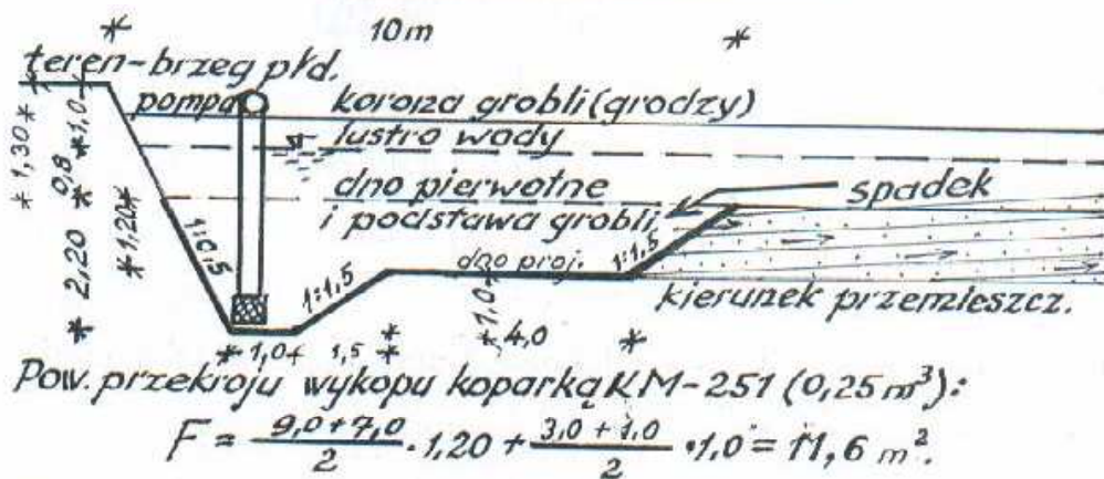
Załącznik: Rys. 2. Schemat odwodnienia:

Przesięgające przez groble i ich podłoże wody będą spływały po powierzchni odkładu i jego skarpe czołową wytworzoną dzięki spadkowi zadaneemu przez spycharki, do rowu. Z rowu - będą odpompowywane poza groble. Z części 2 - przez groble Nr 1 do części 1; z części 3 - przez groble Nr 3 do zbiornika przy E-7. Nie przewiduje się konieczności wypompowywania wody z cz. 2 i cz. 3 jednocześnie (gdy wykorzystuje się cz. 2 - to z cz. 3; gdy wykorzystuje się cz. 3, to z cz. 2.), z wyjątkiem rozbiórki grobli Nr 2.