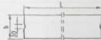
Rys. 1. Wymiarowanie krawężników

c) wpusty na powierzchniach stykowych krawężników